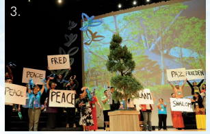
1, 2; Cloi yr Ymgyrch "OS" yng Nghasnewydd ym mis Hydref. 3; Cynhyrchiad llwyfan yng Nghynhadledd Egwysîr Byd yn Busan, De Korea 1, 2; Closing the "IF" Campaign in Newport, October. 3; Presentation at the WCC Conference in Busan, South Korea

Gallwch fod yn sicr o weddiâu parhaus Cytûn drosoch wrth i'r gymuned Gristnogol ledled Cymru nodi dyddadus diwinyddol tymor yr Adfent a phrif ddeathliad y Nadolig. Yn addas iawn i offeryn ecwmenaidd cenedlaethol Cymru, mae ein gweddi'n adlewyrchu uwch weddi offeiriadol Crist: y byddwn ni yn un fel bod y byd yn credu.